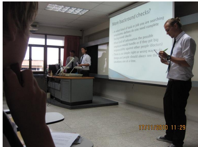
1. Esitelmän pitoa

AE Phuketin Prince of Songkla vaihto-ohjelmasta löytyy reilut kymmen kurssia, joista valitaan 3-4 mieleisintä. Valittavat kurssi löytyvät AE:n nettisivuilta. Omiin valintoihini kuului Leadership, Principle of Marketing, Human resources ja Thai food preparation. Olin kuulut joistakin lähteistä, että Aasian kurssien taso on paljon huonompi kuin Suomessa ja saattavat tuntua suomalaisista opiskelijoista pilipalikusseilta. Tämä väite osoittautui kuitenkin epätodeksi ainakin Prince of Songklan kohdalla. Kurssit yllätivät minut vaatavuudellaan. Jokainen kurssi sisälsi 80% läsnäolopakon, lukuisia case-tyyppisiä harjoituksia (Thai food -kurssia lukuun ottamatta), esseitä ym. Opiskelu materiaali oli myös laadukasta. Luennoitsijat olivat hyviä; mielenkiintoisia kuunnella, selkeitä ja esittivät asiat johdonmukaisesti. Mukaan tosin mahtui yksi poikkeuskin.